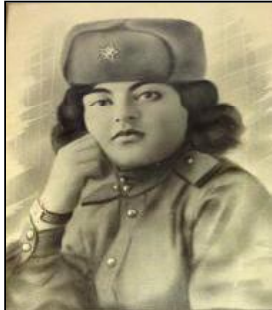
армию. Все их действия были оборонительными.

Сама того не замечая, Мозолут стала крепче, мускулистой, всё вернулось, выделялась среди сверстниц, между делом каждую девочку обучали оказанию помощи пострадавшим на фронте, от ранений, ожогов, переломов и вывихов, делать уколы и перевязки. Вот так потихоньку она сама стала инструктором, обучала новеньких, а её инструкторов забирали на фронт, на передовую северного Кавказа, в район ГМоздок, куда в дальнейшем и она сама попадает, в действующую