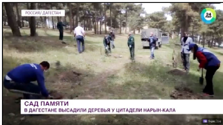
САД ПАМЯТИ В ДАГЕСТАНЕ ВЫСАДИЛИ ДЕРЕВЬЯ У ЦИТАДЕЛИ НАРЫН-КАЛА

Гьемме гереклуе информацие э товун акцие вери э сайт – богъеровурди2020.pф.