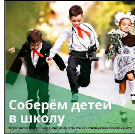
Соберём детей в школу

Дагестанские Огни – 96 нужд., 8 сирот, Табасаранский район – 157 нужд., 54 сирот, Куррахский район – 4 сирот, Кайтагский район – 15 нужд., 7 сирот, Бабаюртов. район – 151 нужд.,