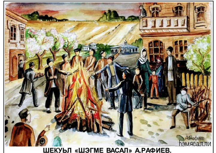
ШЕКУЬЛ «ШЭГМЕ ВАСАЛ» А.РАФИЕВ.

Эзге мунди гьэдот гировундеи миглид «хэмисали» эри догьлуье жугьурго? Гьеле э вэгьэдой Битемигьодош, Сангедрин (дывуни) мэглум сохде оморебу э товун сер гьурдеи тозе меь, эри эну, чукьни гьеммией Израиль дану э товун сер гьурдеи тозе меь Нисан. Э суьфдеи шев Нисан э Иерусалим э гьундурди дегесунде оморебу келе гьэтош. И гьэтоше виниребируьт экуьнди Иерусалим деригьой шегьерго, гьечуь угьой дануьсдебируьт, ки сер гьурде омори тозе меь. Э нубот хуьшде угьой дегесундебируьт гьэтошгьоре, чукьни угьонигее шегьергош дегесунуьт гьэтоше, гьечуь мэглум сохде оморебу э товун сер гьурдеи тозе меь. Гьеммией дануьсдебируьт, ки бэгьдой гьирошдеи 15 руьзго сер гьурде миев миглид Песах.