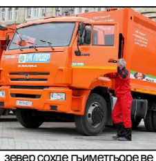
звер сохде гьиметгьоре ве хьозурь бирим кор сохде э

Э информация гурье, компание «Пушобер» межбуьр бируьт поюнде кор хуьшдере, э сереботи кура биригьой четинигьой, комигьорекки гьемел ниев гьэрор сохде би кумеки хуькуьмет гьемчун эн гьемей субъектгьой шенденуьгьой хокоруре гьэрхундигьой хуьшдере не веровундугьей.