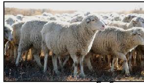
миноне – э догъгьо. 1 усбендгьо дошде веровунде оморенуьт э

Догъисту э конкурс нушудори шеш жирегьой молгьой хурекире: гушд гусбенди Догъистуре, гъэйсие дишов Догъистуре, пени гусбенди Догъистуре, хуьшке колбаси Догъистуре, чой Догъистуре ве урбеч Догъистуре.