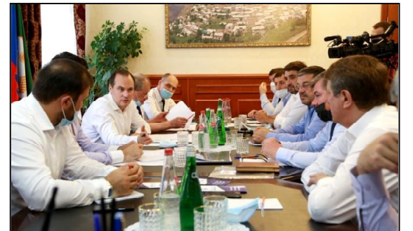
Имбуруз Хуькуьм регион

желдлуь гировундени коре э товун доруние республикански корхонегьо гьемчунь гьисди хубе жуьмуьсдеи. Гьечуь, вокурдени объектгьоре э Догуьсти э кор венгесде оморени вокурденигьо молгьо, комигьои ведешенде оморенуьт э Догуьсти. Э гьонине вьзд цемент ве хуьше вокурденигьо молгьо, товгьо ве системегьой гермидорей, молгьо эри дешенде бунгьоре, арматуьре ве дергьо. Гьеммие энугьо ведешенде оморенуьт э Догуьсти эз е жигейгегьо овурде нисе оморе. Эзуш бэгъэй, чунь риз кеши рэхъберьет Министресте вохурдеи республике, герек зиед сохде корхонегьоре эри ведешенде е жерге вокурденигьо молгьоре, комигьои эи вьзд лап гьяти.