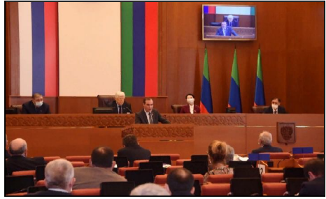
денки артгой гуярдлемере.

В.Васильев гуфди, ки гьэрейкэлгье аэропорт «Махачкала» кор мисоху дошденки гьемме буйргьуйгой Уруссиетлуе потребительски назари эн Уруссиетлуе Федерацие э товун гировунде оморигьо кор ве доре оморигьо гьувот, рэхьбер регион магьлум сохд, чьу расирениге э одомигьой Азербайджан комигьоки деруэ э уруссиетлуе-азербайджански серхьэд э Магарамкентски район. Гьемчун э товун одомигьой Уруссиет, комигьоки вогоще оморенуэ э вилеет хуьшде, э кор венгесде оморенуэ гьемме ге-