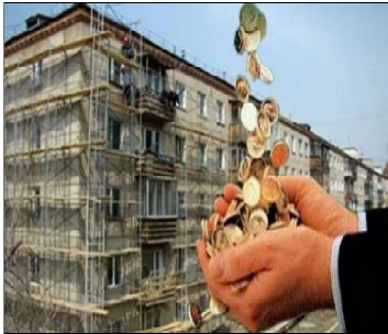
монта жилых помещений.

В Дербенте недавно состоялась торжественная сдача работ по программе капитального ремонта в многоквартирном доме по адресу 345 Дербентской стрелковой дивизии. Этим событием Фонд капремонта завершил первый этап программы на территории города. В рамках первого этапа было отремонтировано 10 многоквартирных домов.