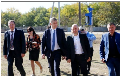
э электрически сетью.

Э 2020-муьн сал э план норе омори оводу сохеи мескен мемориальни комплексе, гьисдигоь экуьнди боьгне ве мейдон, э хотур энун бегьем сохе миев тозеден сохеи меркезлуье шеьгерлуье боьгьере гьемчуьн экуьнди гьисдигоь мейдонгъоре, дарафденигоь э еклуье комплекс жигей форигъэти одомигъо.