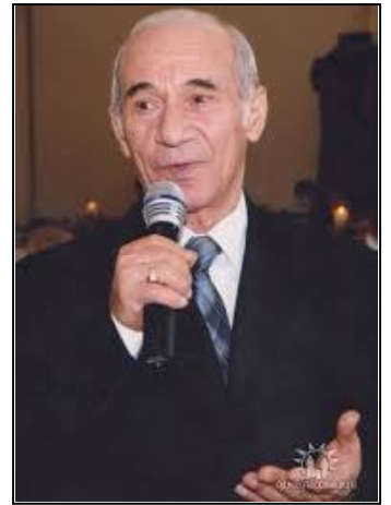
ренигго фольклер республикере.

Э хьотор омаре жофо ве хубе дананигго эн вежегисдене фольклер, тербие дорение усдоети, хэрекети вокошире вежегисдене базуренди Догысту-ре э тозе качественни риз, глэмел бири бэгъдой э сал гуынкуунде пуре тегьерлуе концертни програме, э комики дарафдет 18 вежегисдеигго, нушу до-