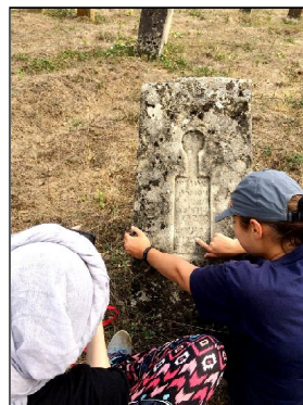
Подготовила Ирина МИХАЙЛОВА.

29 августа экспедиция завершилась. Впереди участникам предстоит большая работа. Пожелаем им успеха!