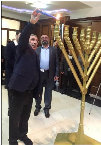
сухде оморебу э кузовле хьэшд рузигеш. Эзу товун

деним, чуьтам хэлгь иму вэхуьшдебу э гьэршуй зулумкорҗо ве шори сох- деним э бараси бебе-келе- бебегьо э сер душменгьо. Гьэҗгьигьэт у вэхд э миг- дош бири муьгьуьжуйз э кузовлей ругьэревоз, ко- мики бири еки эз җемме очугьэ вэрэҗгьой торих иму. Торих эни миглид сер гуьрдебу э девр Дуьимуьн мигидош, кей э Хори Исро- ил нушу доробу грекҗо. Сер суьфде уҗо сохди зугьун хуьшдере хуькуь- метлуь, эзумбэҗдоиге овурдет гречески нумгьо ве монетгьоре. Сер гуьр- де оморебу телеф сохдеи дин-доглоти егьудиҗоре. Эзумбэҗдоиге тигьы бире-