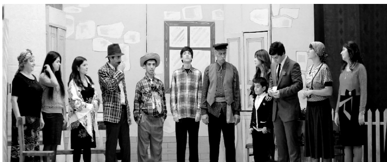
Муниципальный горско-еврейский театр приглашает горожан и гостей Дербента на спектакль «Муьрде зе глэрей зиндегь» по пьесе Х.Авшалумова, который состоится 29 октября 2017 г. в 15.00 в клубе детского творчества «Жасмин» (г. Дербент ул. III-Интернационала, 8, парк Кирова). Вход свободный.